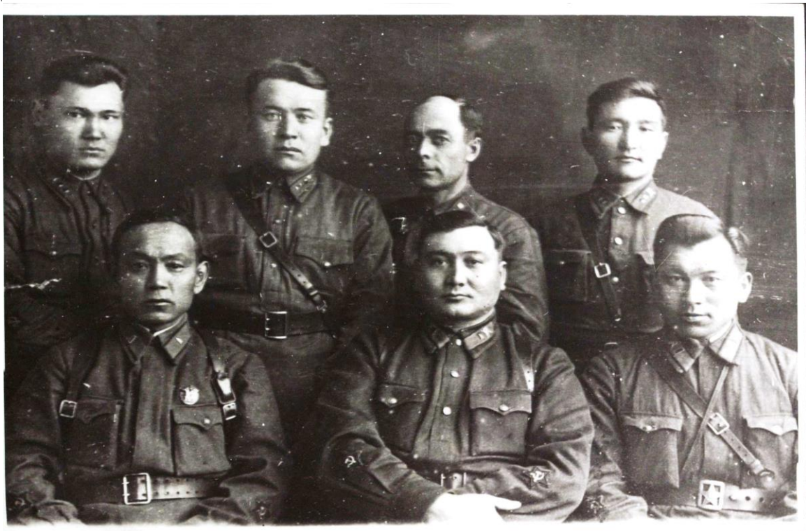
Офицеры 106-й Казахской кавалерийской дивизии