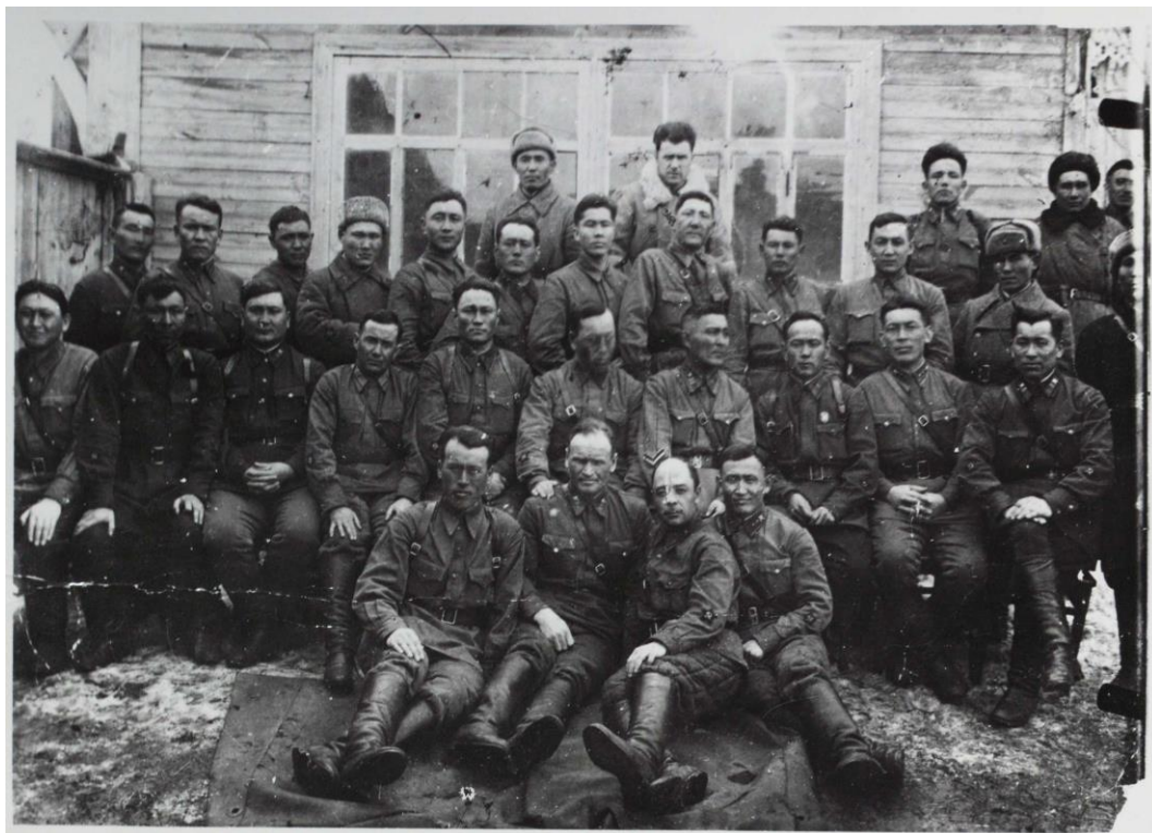
Воины 106-й Казахской кавалерийской дивизии